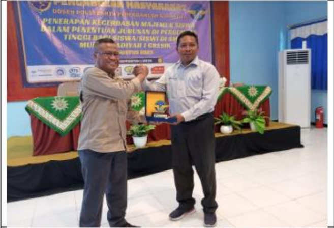
Serah terima cendera mata dari Wadir 1 Politeknik Penerbangan Surabaya kepada Kepala Sekolah SMK Muhammadiyah 1 Gresik