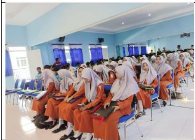
Peserta Kegiatan PKM