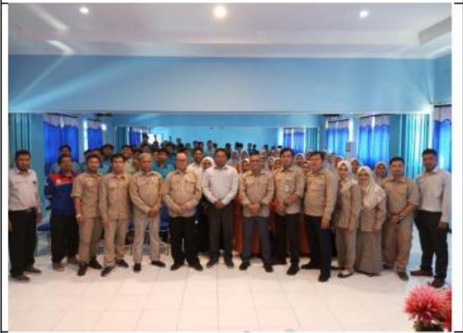
Foto bersama antar Dosen Politeknik Penerbangan Surabaya dan Dewan Guru SMK Muhammadiyah 1 Gresik