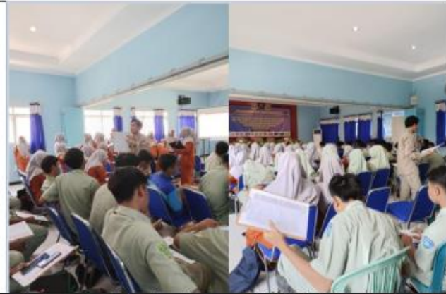
Kegiatan Penyuluhan kepada peserta PKM di SMK Muhammadiyah 1 Gresik