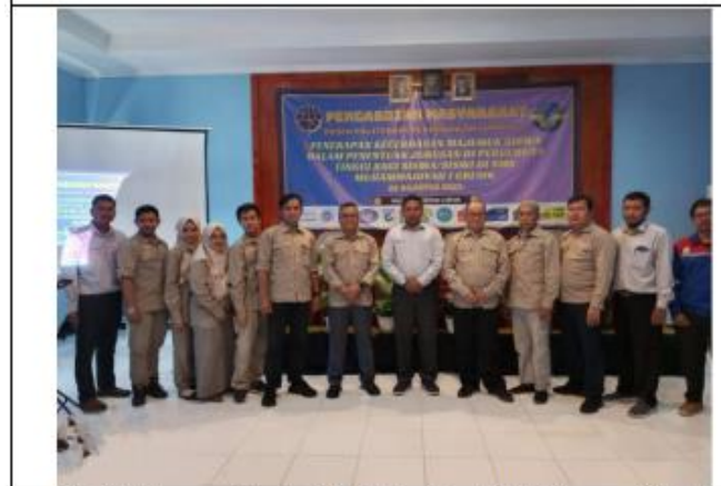
Tim PKM bersama Kepala Sekolah dan Guru SMK Muhammadiyah 1 Gresik