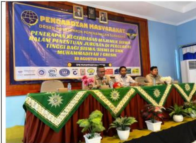
Sambutan Wakil Direktur 1 Politeknik Penerbangan Surabaya