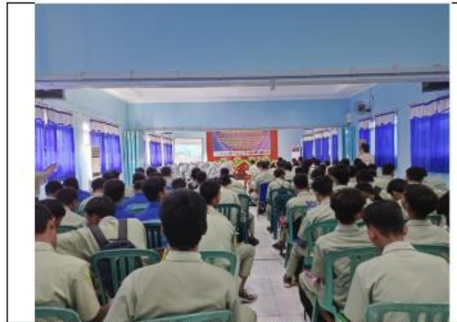
Lokasi kegiatan Pengabdian kepada Masyarakat Program Studi Lalu Lintas Udara di SMK Muhammadiyah 1 Gresik