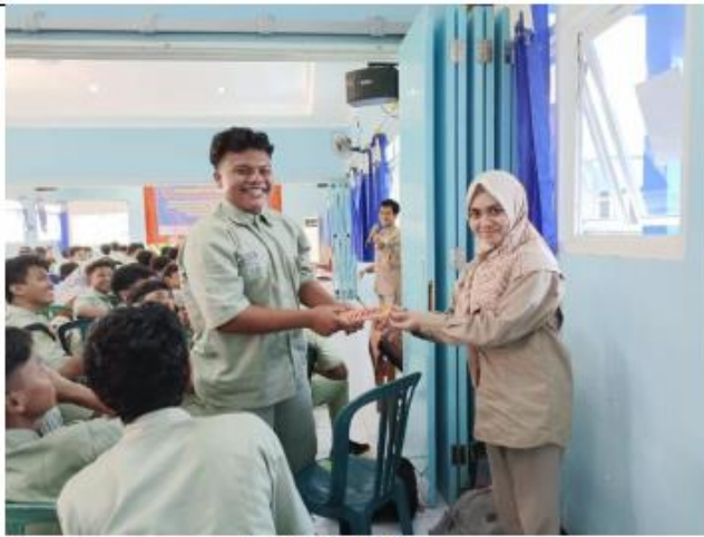
Pemberian hadiah games