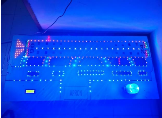
Gambar 4. Pengujian Mockup

Pengujian alat ini dilakukan untuk mengetahui apakah komponen sudah dapat dioperasikan dengan baik atau belum.