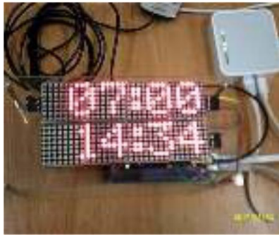
Gambar 2 : Uji Coba Rancangan di Ruang kelas TNU VII