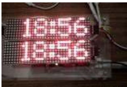
Gambar 3 : Uji Coba Rancangan di Pos Satpam Politeknik Penerbangan Surabaya