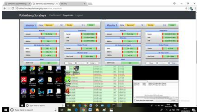
Gambar 3. Pengujian Analisa Software

Rancangan dapat memunculkan data di web sesuai dengan yang ditampilkan dalam PC PMDT secara real time.