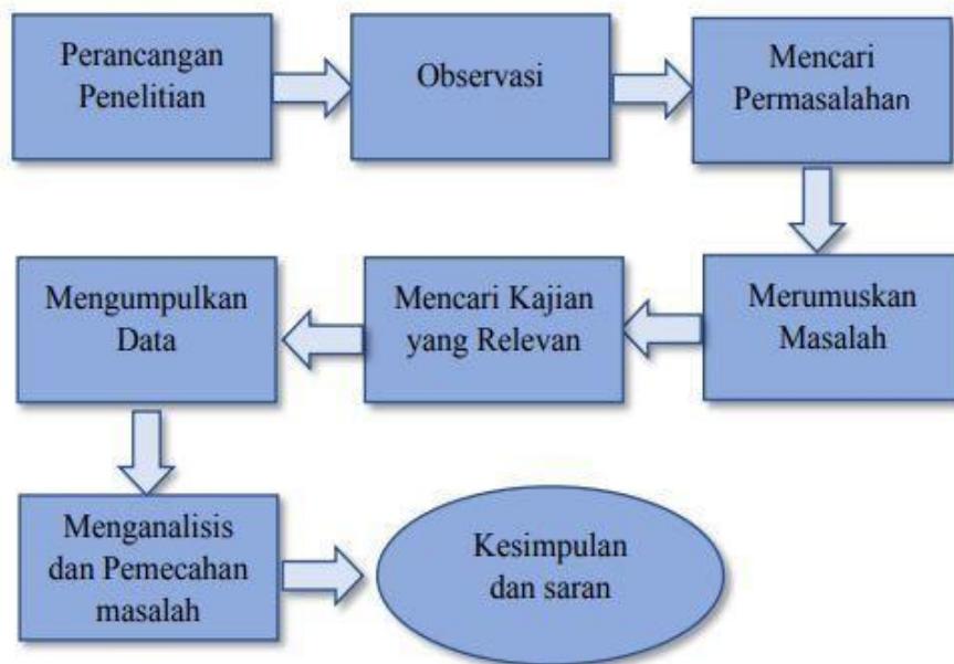
Gambar 1 Desain Penelitian