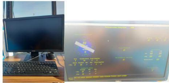
Gambar 3 AWOS Unserviceable

Hasil observasi penulis dalam pemberian pelayanan informasi cuaca terhadap pelayanan lalu lintas penerbangan di Perum LPPNPI Unit Sibolga kepada pilot seperti yang dilakukan saat penulis melaksanakan On The Job Training Aerodrome Flight Information Service di Bandar Udara Dr. Ferdinand Lumban Tobing.