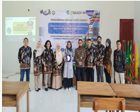
Foto bersama perwakilan SMK Muhammadiyah 5 Gresik dan Tim Poltekbang Surabaya