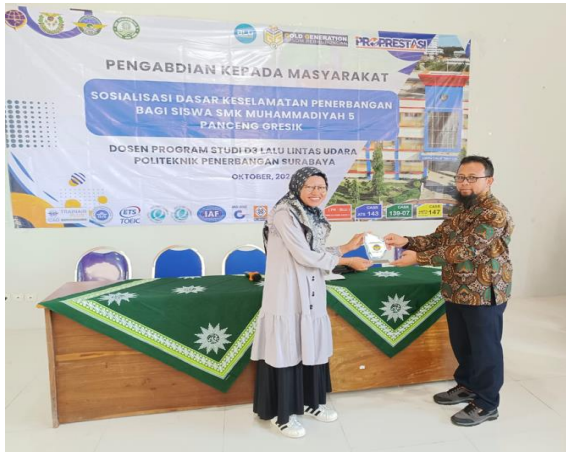
Penyerahan Vandel kegiatan PKM