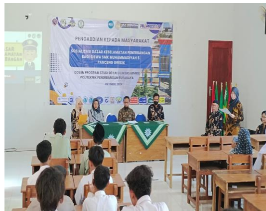
Pembukaan Kegiatan PKM