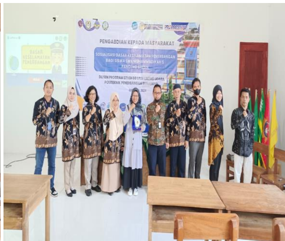
Foto bersama perwakilan SMK Muhammadiyah 5 dan Tim Poltekbang Surabaya