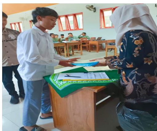
Penyerahan Sertifikat dan Souvenir untuk Peserta PKM