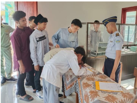
Pengisian presensi kehadiran peserta PKM