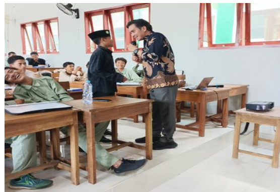
Pemberian materi sosialisasi dasar keselamatan penerbangan