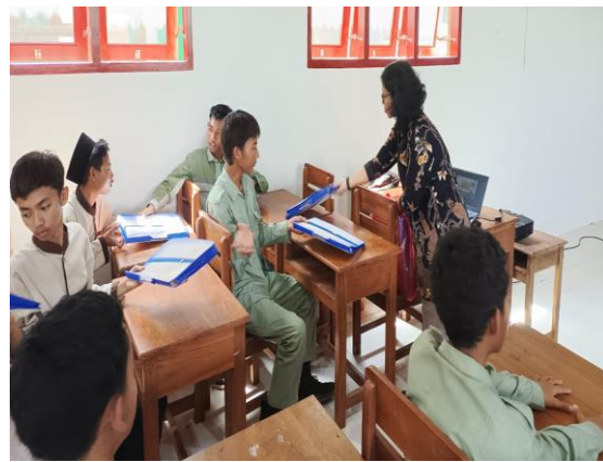
Penyerahan Peralatan kegiatan kepada peserta PKM