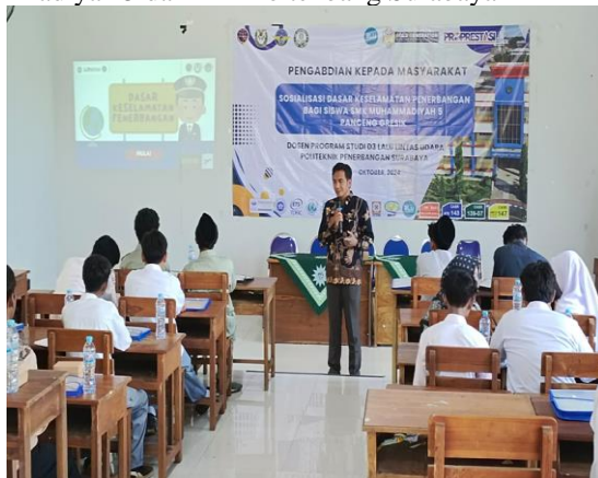
Pemberian materi sosialisasi dasar keselamatan penerbangan