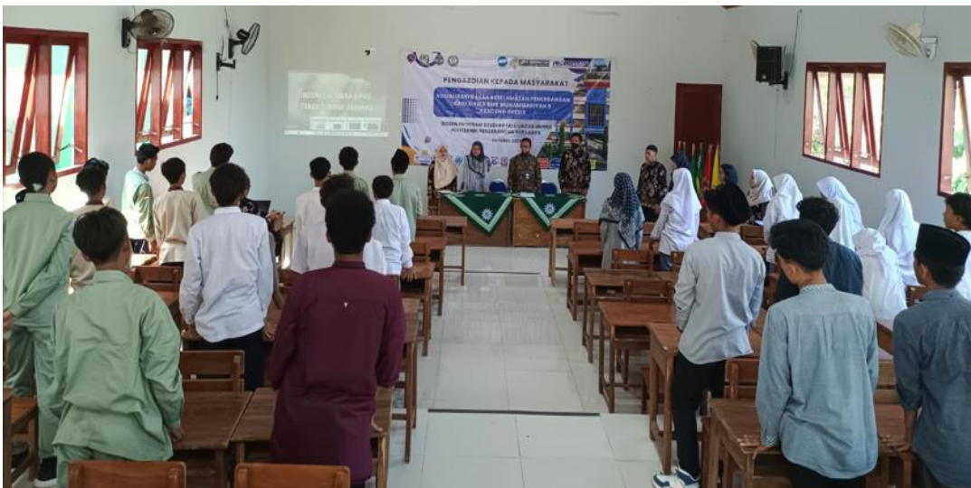
Menyanyikan Lagu Indonesia Raya