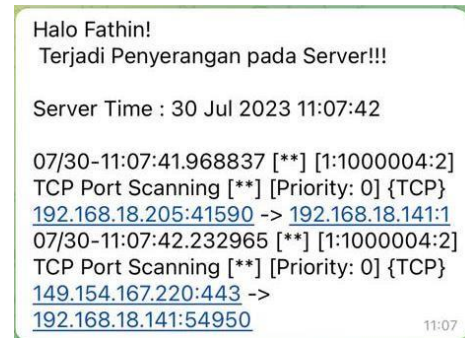
Gambar 2 Notifikasi Serangan Nmap

Notifikasi muncul pada Admin saat pengujian serangan Nmap pukul 11:07:42 dengan keterangan “TCP Port Scanning” dari IP 192.168.18.205 menyerang IP 192.168.18.141.